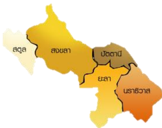
กลุ่มจังหวัดภาคใต้ชายแดน

สำนักงานศึกษาธิการภาค 8 เป็นหน่วยงานที่เกิดขึ้นตามประกาศกระทรวงศึกษาธิการ เพื่อให้การบริหารราชการของกระทรวงศึกษาธิการในภูมิภาคเป็นไปด้วยความเรียบร้อย โดยอาศัยอำนาจตามข้อ 2 และ ข้อ 7 ของคำสั่งหัวหน้าคณะรักษาความสงบแห่งชาติ ที่ 11/2559 เรื่อง การบริหารราชการของกระทรวงศึกษาธิการในภูมิภาค ลงวันที่ 21 มีนาคม 2559 รัฐมนตรีว่าการกระทรวงศึกษาธิการจึงประกาศให้จัดตั้งสำนักงานศึกษาธิการภาค สังกัดสำนักงานปลัดกระทรวงศึกษาธิการขึ้น โดยกำหนดให้สำนักงานศึกษาธิการภาค 8 ตั้งสำนักงานอยู่ที่จังหวัดยะลา รับผิดชอบดำเนินงานในพื้นที่ จังหวัด 5 จังหวัด ชายแดนใต้ ในเขตตรวจราชการที่ 7 ได้แก่ จังหวัดนราธิวาส จังหวัดปัตตานี จังหวัดยะลา จังหวัดสงขลา และจังหวัดสตูล